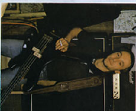
El disco va a aparecer en Mayo con seguridad, y se va a titular "Corre, Corre"

Ellos acaslumbrar a tocar pocas galas al mes, alrededor de cuatro, no es un grupo que trabaje a tope.